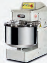
TAURO Impastatrici a spirale con vasca fissa o estraibile Benchtop spiral mixer with fixed or removable bowl