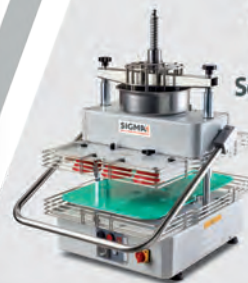
DR1411 Spezzarrotondatrice da banco semiautomatica Semiautomatic benchtop divider-rounder